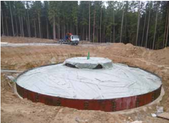
11.09.2015 Gegossenes und geschaltes Fundament