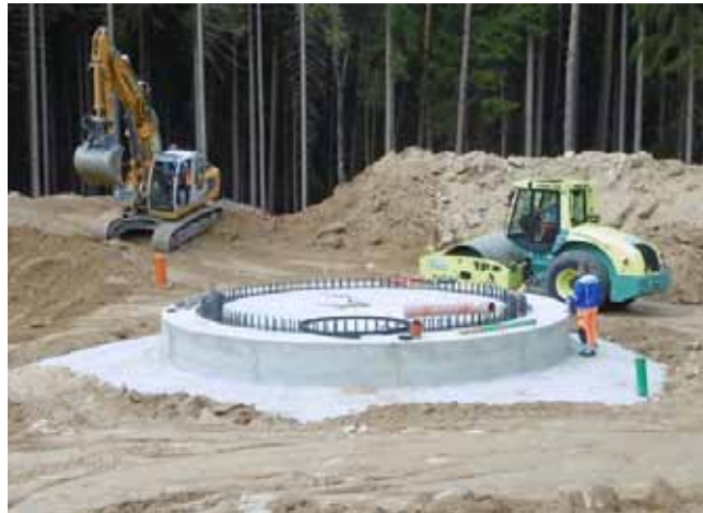
05.10.2015 Das Fundament ist fertig, die Baugrube ist aufgefüllt